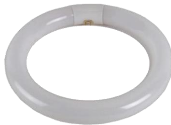
Lineárna žiarivka kruhová