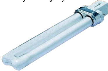
Kompaktná žiarivka s päticou

Medzi odpad patria žiarivky a výbojky, ktoré obsahujú ortuť používame za účelom vytvorenia umelého alebo prídavného osvetlenia v domácnostiach, skladových priestoroch, vonkajších priestoroch, garáží, a pod.. Môžu byť kompaktné alebo lineárne. Lineárne žiarivky sa niekedy nazývajú aj neónové trubice, čo nie je správne, pretože žiarivka neobsahuje neón. Svetelné zdroje, ktoré sú založené na princípe tlejivého výboja v riedkom neóne sú napríklad tlejivka, alebo neónová výbojka.