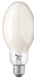
Vysokotlaková ortuťová výbojka

Kategória č.5 Svetelné zdroje napr.: lineárne a kompaktné žiarivky, vysokotlakové výbojky vrátane sodíkových výbojok a výbojok s kovovými parami atď.