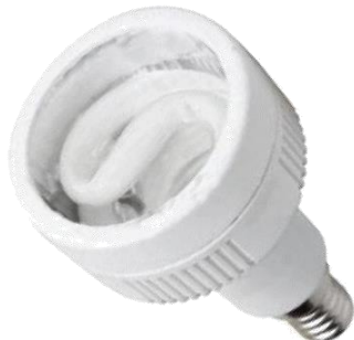
Kompaktná žiarivka so závitom